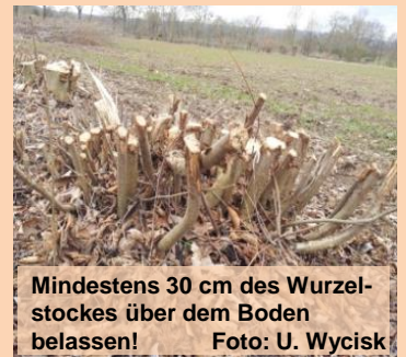
Mindestens 30 cm des Wurzelstockes über dem Boden belassen!

Zur Bestandspflege sollten Hecken ca. alle 10 Jahre, mindestens jedoch alle 25 Jahre auf den „Stock“ gesetzt werden (s. Bild rechts), um die Entwicklung von kräftigen Heckenpflanzen zu fördern. Dabei sollte die Verjüngung bei längeren Hecken nur abschnittsweise erfolgen, damit die ökologische Funktion für heckenbewohnende Tiere stets aufrechterhalten bleibt. Keinesfalls darf die Hecke bodengleich abgeschnitten werden, da dies im Laufe der Zeit das Absterben der Hecke zur Folge hätte!