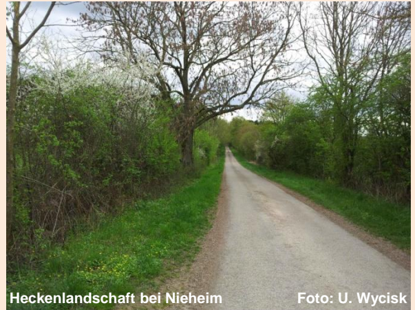
Heckenlandschaft bei Nieheim

Hecken sind wertvolle Biotope in unserer landwirtschaftlich geprägten Kulturlandschaft. Sie bieten zahlreichen Tier- und Pflanzenarten Lebensraum und tragen zum Wind- und Erosionsschutz, zum Biotopverbund sowie zur Aufwertung des Landschaftsbildes bei. Dieses Merkblatt soll Hinweise liefern, wie eine fachgerechte Heckenpflege in der Praxis umzusetzen ist. Nur so ist der dauerhafte Erhalt dieser ökologisch so wichtigen Strukturelemente gewährleistet.